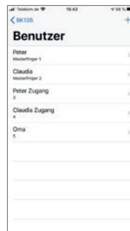
Hinzufügen und löschen von Master- und Benutzerfingern:

Benutzerverwaltung -> User-Finger Hinzufügen (+)