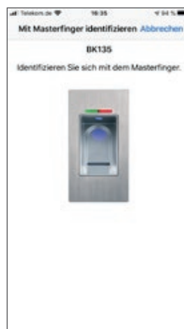
App-Zugang über Masterfingerberechtigung am Scanner.